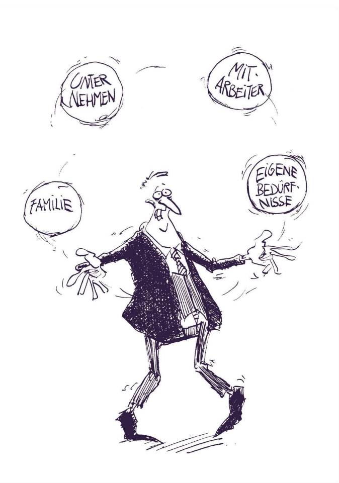
Karikatur von Thomas Pläßmann ©