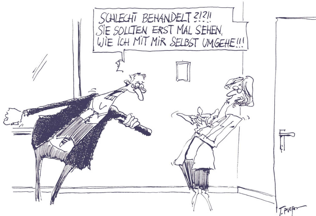
Karikatur: Thomas Plaßmann (copyright)